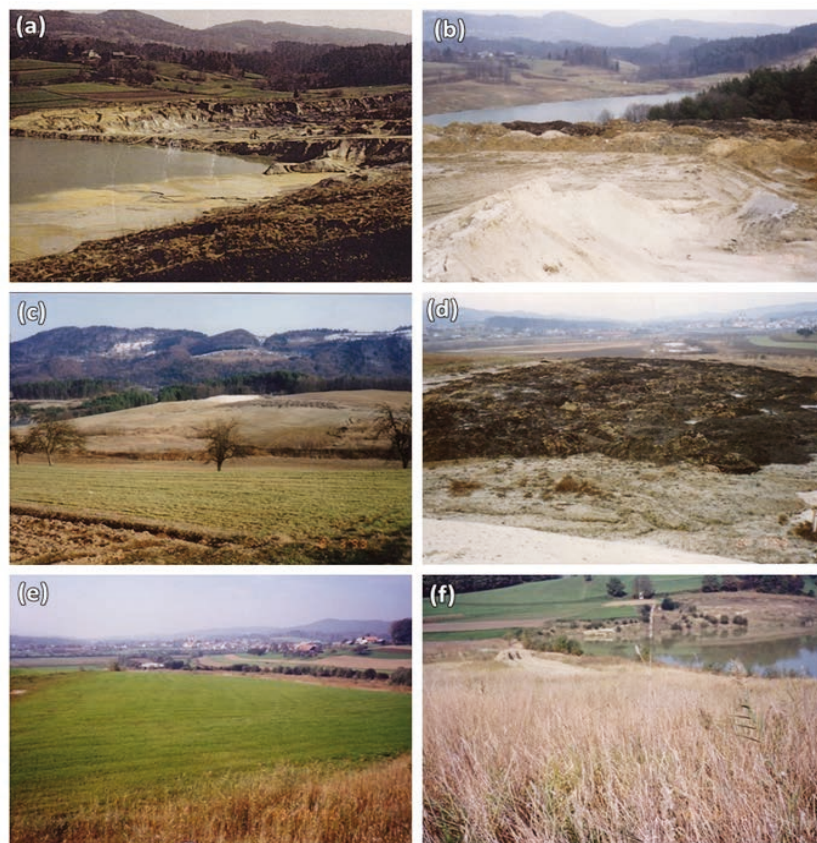
Slika 3: Prikazi stanja okolja na območju peskokopa Drtija od leta 1981 do 1996: (a) leto 1981– zasipavanje s separacijskim muljem, (b) leto 1992 – teren zapolnjen s krovino in glino, (c) leto 1993 – poravnani teren (približno 7 ha), (d) leto 1993 – nasutje rodovitnega materiala (mulj iz bližnjega ribnika), (e) letnica neznan – stanje po sanaciji in rekultivaciji, (f) 1995 – stanje po sanaciji in rekultivaciji