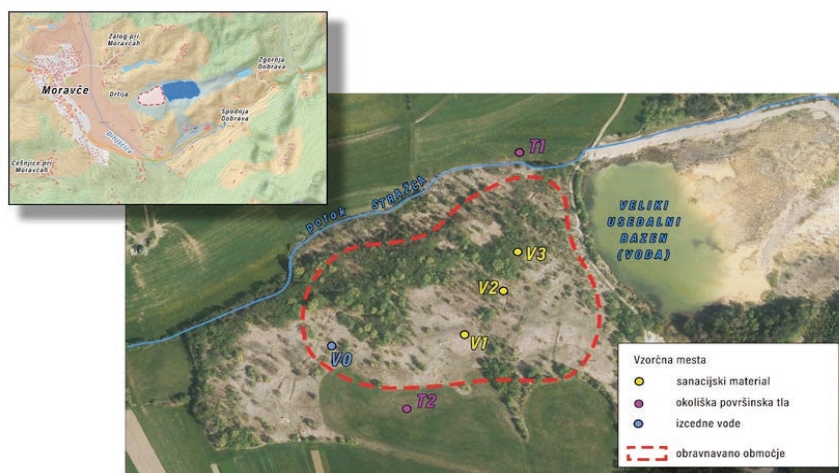
Slika 1: Obravnavano območje z lokacijami vzorčenja na letalskem posnetku med leti 2009 in 2011

Terciarni sedimenti so pričakovano srednje prepustni ( K \sim 4,6 \times 10^{-6} \text{ m s}^{-1} ), prav tako je izdatnost vodnjakov v teh sedimentih ocenjena na 3\text{--}4 \text{ l min}^{-1} (Marinko in sod., 1975). Prepustnost apnencev je ocenjena na 3,88 \times 10^{-3} \text{ m s}^{-1} (Rogelj in Karahodžič, 2004). Gladina podzemne vode se lokalno lahko nahaja na kontaktu med krovnino in talnino različnih slojev terciarnih se-