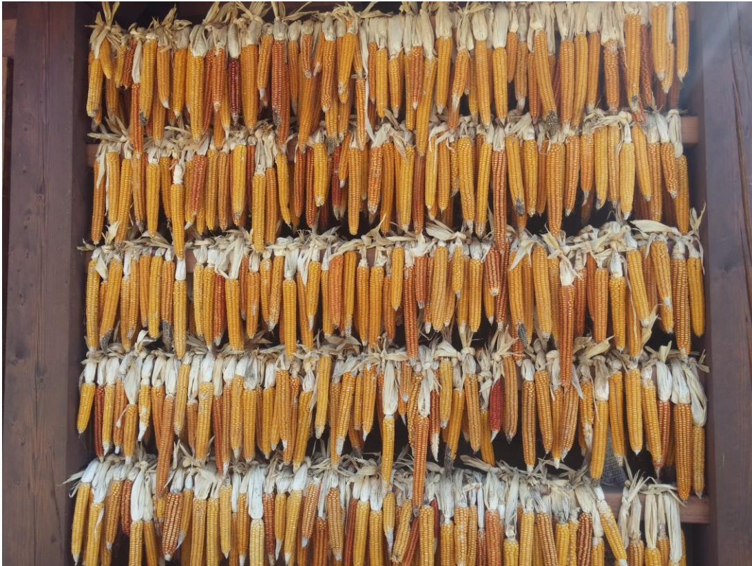
Slika 3: Variabilnost akcesije 'Metliška Plut' pri vzdrževalcu (Aleš Plut, Cerovec 17, Semič) (pridelek 2016). Figure 3: Variability of accession 'Metliška Plut' at maintainers site (Aleš Plut, Cerovec 17, Semič) (yield 2016)

Rezultati naše raziskave kažejo, da se lokalne populacije različno odzivajo na abiotične in biotične dejavnike. Andjelković in sod. (2014) denimo navajajo, da so bile različne akcesije koruze različno odporne na sušo.